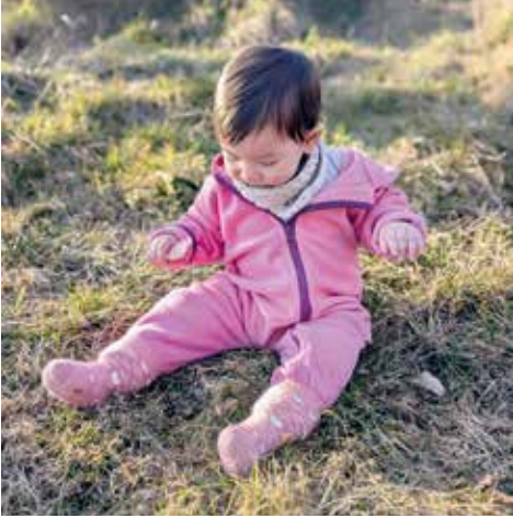
FAMILIE GHERVASIA AUS DER KRABELSTUBE POMMERNSTRASSE

Den Tag zu dritt beim Rodeln zu verbringen, sowie auch den Schnee zum ersten Mal bewusst zu erleben und einen Schneemann zu bauen, war für unsere Kleine was ganz Besonderes. An dunklen, kalten Tagen in der Stadt werde ich jedoch zum Kältemuffel und unserer Tochter wird die Winterkleidung langsam lästig. Daher freuen wir uns alle aufs Ende der Winterkleidung und auf längere sonnige Tage. Bald gibt's wieder lange Spaziergänge an der Donau, mal ein Picknick in der Umgebung oder ein Besuch in den Tiergarten. Wenn wir dann wieder in der Sonne liegen und ein bisschen Vitamin D tanken, sind wir gleich bei guter Laune. Für unsere Tochter wird es diesmal bestimmt spannender, das Erwachen der Natur zu erleben und Schmetterlinge zu beobachten.