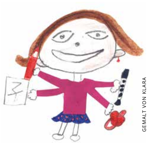
GEMALT VON KLARA

Es fing eigentlich schon kurz nach der Geburt unserer Tochter an. Freundinnen und Kolleginnen mit älteren Kindern fragten mich, ob ich mich denn schon um Kurse gekümmert hätte. Auf jeden Fall sollten wir zum Baby-Schwimmen, zur Baby-Massage und PEKiP - und dann vielleicht noch in eine Spielgruppe und zum Yoga. Meine innere Stimme sagte damals, Moment! Das hat doch alles noch Zeit. Ein leiser Zweifel blieb aber, ob wir unserem Kind nicht etwas vorenthalten. Mittlerweile ist unsere Tochter 1 Jahr alt und geht in die Kita. Vor kurzem war eine Freundin mit ihrem Dreijährigen bei uns zu Besuch und fragte mich, ob wir eigentlich in eine Spielgruppe gehen. Da war er wieder, der leise Zweifel. Sie trifft sich einmal in der Woche mit 10 anderen Müttern und deren Kindern. Ich hatte das bislang nicht vor, denn unsere Tochter spielt ja schon am Vormittag fleißig mit anderen Kindern und ist am Nachmittag manchmal auch recht erschöpft. Trotzdem recherchierte ich