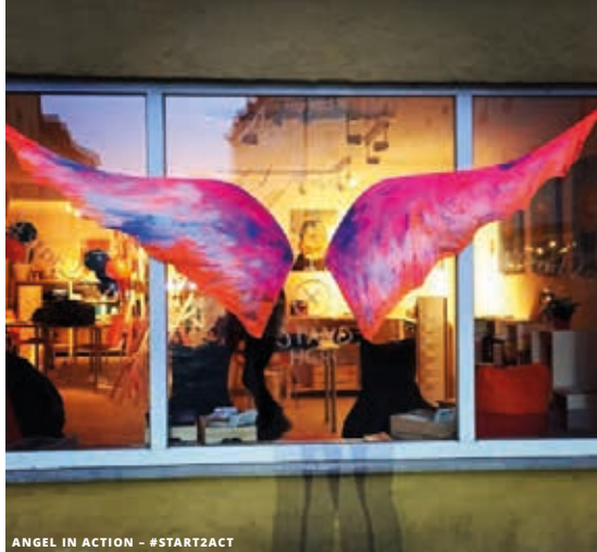
ANGEL IN ACTION - #START2ACT

Seit dem Herbst 2017 ist KulTür e.V. (i.Gr.) ein gemeinnütziger Verein, der die Tätigkeiten und Felder von Kulturvermittlung und Teilhabe in den Fokus der ehrenamtlichen Arbeit stellt. Die Idee von KulTür steht und fällt mit der Unterstützung von Menschen für Menschen. Sponsoren, Kulturträger, Sozialpartner und engagierte Ehrenamtliche sind diejenigen, die es möglich machen, dass kulturelle Teilhabe kein Luxusgut bleiben muss, sondern ein wichtiges Element für ein gutes Miteinander in einer Zeit ist, in der die Gesellschaft auseinander zu driften droht. Seien Sie auch dabei und helfen Sie mit.