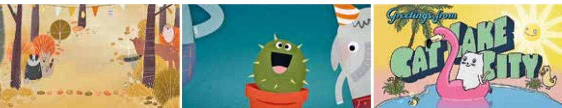
LE DERNIER JOUR