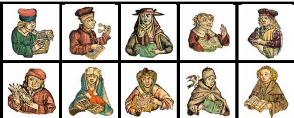
Bilder aus der Schedelschen Weltchronik 1493