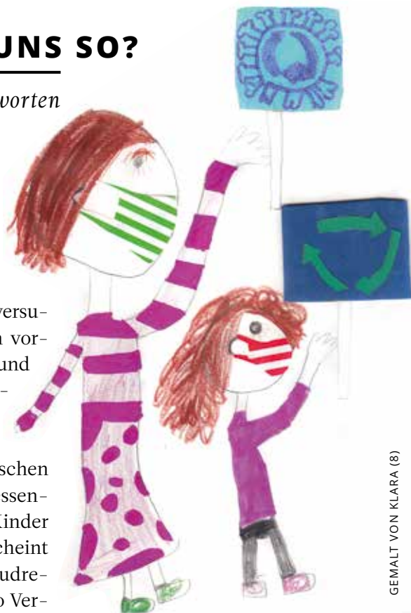
GEMALT VON KLARA (8)

Meine Frau und ich möchten unsere Kinder (5, 8 und 12 Jahre) umweltbewusst erziehen: wir versuchen Müll zu vermeiden, fahren vorzugsweise mit Bus und Bahn und waren zusammen schon auf mehreren Fridays for Future Demos. Eigentlich waren wir zuversichtlich, dass immer mehr Menschen begreifen, dass Umweltschutz essentiell für die Zukunft unserer Kinder ist, doch mit der Corona-Krise scheint sich das Rad wieder zurückzudrehen. An jeder Ecke gibt es To-Go Verpackungen aus Plastik, aus Angst vor Ansteckungsgefahr fahren die meisten Menschen mit dem Auto in die Arbeit oder den Urlaub und in den Nachrichten haben wirtschaftliche Fragen klimapolitische Ziele verdrängt. Mir ist schon klar, dass wir in einer akuten Krise sind und Hygienevorschriften und Rettungspakete wichtig sind. Trotzdem würden wir gerne weiter umweltbewusst leben.