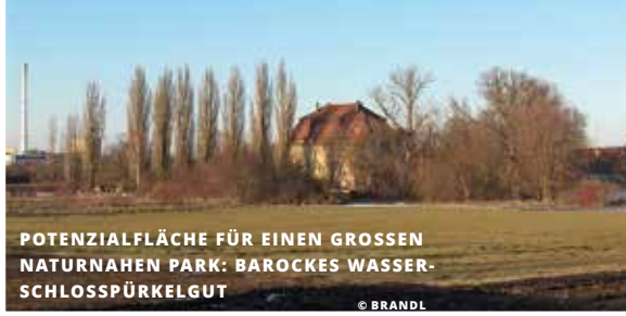
POTENZIALFLÄCHE FÜR EINEN GROSSEN NATURNAHEN PARK: BAROCKES WASSERSCHLOSSPÜRKELGUT