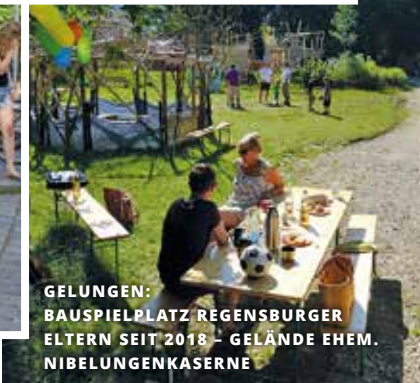
GELUNGEN: BAUSPIELPLATZ REGENSBURGER ELTERN SEIT 2018 - GELÄNDE EHEM. NIBELUNGENKASERNE