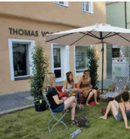
MEHR GRÜN IN DER INNENSTADT: AKTION DES VCD